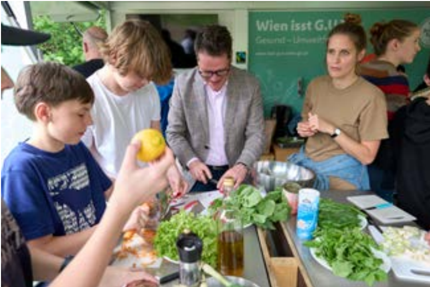
Kinder lernen mit dem Food-Trailer und auf dem Welttellerfeld, wie Lebensmittel nachhaltig produziert und verwertet werden können.