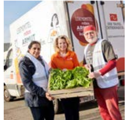
Lebensmittel retten. Armut bekämpfen. Dafür setzt sich Die Tafel Österreich mithilfe von rund 250 Ehrenamtlichen ein