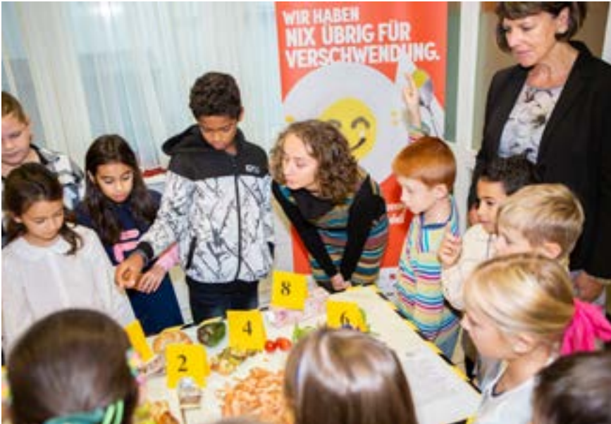
Lebensmittel nicht verschwenden – das ist schon für die Kleinsten ein Thema!