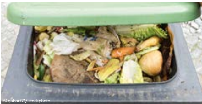
Blick in eine Mülltonne mit zahlreichen Lebensmitteln

In österreichischen Haushalten werden laut offiziellen Angaben jährlich geschätzt rund 520.000 Tonnen vermeidbare Lebensmittelabfälle in den Restmüll geworfen, die bei rechtzeitigem Verzehr als potentiell vermeidbar gelten. 4