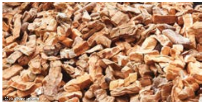
Brot und Gebäck auf dem Weg zur Entsorgung

Persönliches Konsumverhalten beeinflusst nicht nur die Lebensmittelabfälle im eigenen Haushalt, sondern hat auch ganz unmittelbar Auswirkungen auf das Angebot des Einzelhandels. Dieser hat den hohen Anspruch mitaufgebaut, dass täglich rund um die Uhr frisches Brot und Gebäck angeboten werden muss. Durch die damit verbundenen steigenden Erwartungen der Konsument*innen an Auswahl und Frische wird in Bäckereien und Supermärkten oftmals eine hohe Warenpräsenz bis Ladenschluss verlangt. Bereits nach wenigen Stunden hat Brot seinen Frischestatus verloren. Es wird nur für einen Tag als frisch genug befunden, um verkauft zu werden. Die Lebensmittelgruppe der Backwaren veranschaulicht so besonders eindrucksvoll, wie schnell aus wertvollen Lebensmitteln „Abfall“ wird – entscheidend sind oftmals die Minuten vor bzw. nach Ladenschluss.