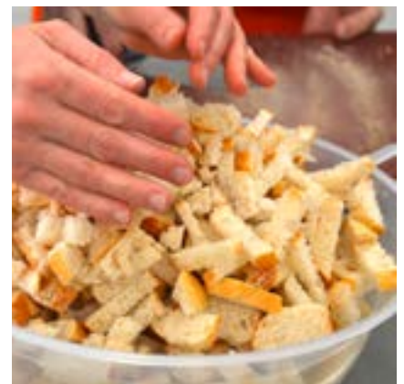
Backwaren sind die am häufigsten weggeworfene Lebensmittel-Gruppe – dabei lässt sich auch aus altem Brot und Gebäck noch Köstliches zaubern (z. B. Knuspersticks)!