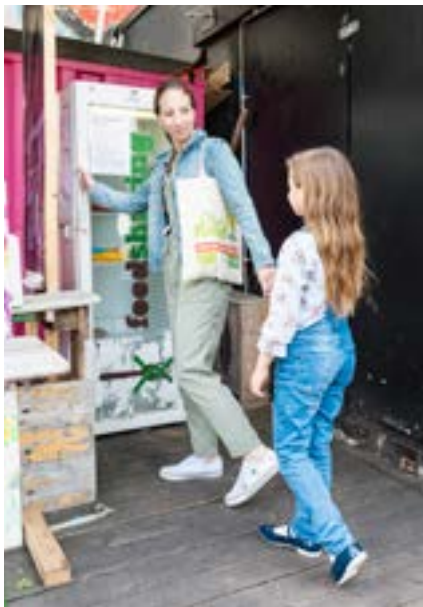
Lebensmittelrettung durch Weitergabe