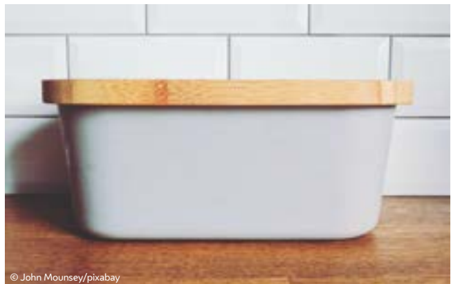
Brottopf aus Keramik mit Schneidbrett

Erfahrungsgemäß haben billig gekaufte Backwaren eine weitaus kürzere Haltbarkeit als Qualitätsware von Handbäckereien. Hochwertige Zutaten, vor allem Vollkorn, wirken sich positiv auf die Haltbarkeit von Brot und Gebäck aus. Während Backstationen in Supermärkten oder Discountern oft Backmischungen verwenden, bereiten kleinere Bäckereien die Brote meist nach eigener Rezeptur zu.